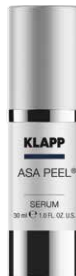
ASA PEEL® SERUM // СИРОВАТКА-ПІЛІНГ Код 1844. Об'єм: 30 мл

Крем для підтримуючого домашнього догляду за обличчям після процедури салонного пілінгу. Основна дія – полегшення відлущування ороговілих часточок та відновлення гідроліпідного балансу епідермісу, згладжування нерівностей мікрорельєфу шкіри, освітлення пігментних плям.