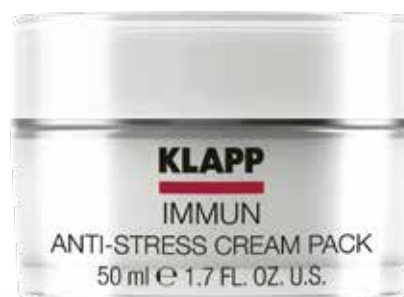
ANTI-STRESS CREAM PACK МАСКА КРЕМОВА «АНТИСТРЕС» Код 1703. Об'єм: 50 мл

Крем легкої консистенції для догляду за чутливою шкірою, схильної до куперозу. Прискорює мікроциркуляцію, зміцнює стінки судин та справляє дренажний ефект. Відновлює водно-ліпідний баланс епідермісу, глибоко зволожує, усуває подразнення шкіри, має антибактеріальні та вологоутримуючі властивості, нейтралізує вільні радикали, освітлює та оздоровлює шкіру.