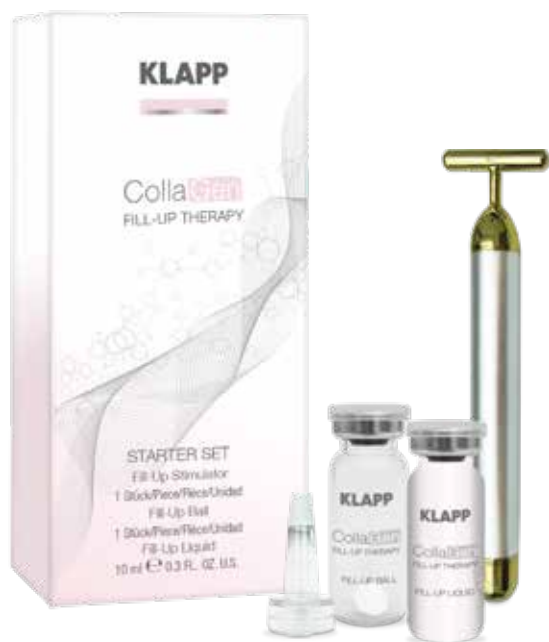
STARTER SET HOME TREATMENT // НАБІР Код 2051. Об'єм: колагенова кулька – 1 шт, активатор – 10 мл, вібростимулятор – 1 шт

До складу набору входить концентрат та вібромасажер. Вібраційний мікромасаж прискорює клітинний енергообмін, звільняє шкіру від ороговілих часток, усуває набрякність, чинить тонізуючу дію. Завдяки вібрації відбувається розширення міжклітинного простору та здійснюється глибоке проникнення косметичних засобів в шкіру. Масажер використовується безпосередньо після нанесення сироватки шляхом обробки поверхні шкіри по масажних лініях впродовж 3-5 хвилин.