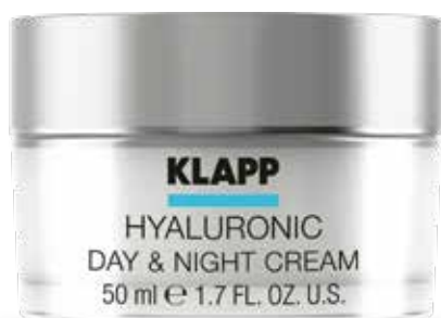
DAY & NIGHT CREAM // КРЕМ «ДЕНЬ-НІЧ» Код 2530. Об'єм: 50 мл

Крем для комплексного догляду за шкірою має інноваційну крем-гелеву текстуру, відновлює гідроліпідний баланс епідермісу, легко всмоктується та справляє загальнооздоровчий вплив: глибоке зволоження, усунення почервоніння та відновлення цілісності епідермісу, антикуперозний ефект, розгладження зморшок, освітлення загального тону шкіри.