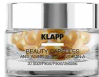
ANTI-AGING SERUM + VITAMIN A ОМОЛОДЖЕННЯ + ВІТАМІН A Код 7209. Об'єм: 30 шт

Для тонкої, сухої і чутливої зрілої шкіри. Відновлює гідро-ліпідний баланс епідермісу, захищає від шкідливого впливу навколишнього середовища, нормалізує природний процес самозволоження шкіри, запобігає роздратуванню і лущенню, стимулює своєчасне відторгнення відмерлих клітин епідермісу, пом'якшує і розгладжує шкіру, має регенераційні та заспокійливі властивості.