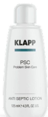
ANTI SEPTIC LOTION // ЕМУЛЬСІЯ «АНТИСЕПТИК» Код 1118. Об'єм: 125 мл

Цілющий тонік для цілеспрямованої себорегуляції сальних залоз. Підходить для жирної, комбінованої та проблемної шкіри, має антисептичну дію, покращує клітинний обмін речовин та регулює діяльність сальних залоз.