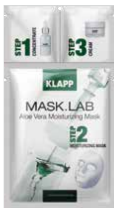
ALOE VERA MOISTURIZING MASK АЛОЕ ВЕРА ЗВОЛОЖЕННЯ Код 5108. Об'єм: 1 шт

Надає загальнооздоровчу та зволожуючу дію, нейтралізує вільні радикали, виводить шлаки і токсини з міжклітинного простору шкіри, заспокоює та пом'якшує шкіру, надає їй свіжості та здорового відтінку, перешкоджає передчасному старінню