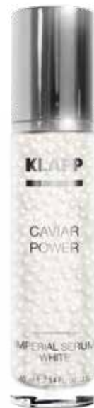
CAVIAR POWER IMPERIAL SERUM WHITE СИРОВАТКА «БІЛА ІКРА» Код 2563. Об'єм: 40 мл

Революційний препарат для дієвого омолодження шкіри, створений із застосуванням останніх розробок в галузі геронтології. Оболонка мікрокапсули виконана з альгінатної мембрани, всередині якої в рідкій субстанції знаходяться діючі інгредієнти. В результаті регулярного догляду сироватка підтягує та ущільнює шкіру, розгладжує зморшки, відновлює природну «архітектуру» всіх шарів шкіри, прискорює клітинний обмін, оздоровлює та надає шкірі свіжості.