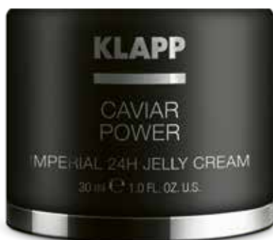
IMPERIAL 24H JELLY CREAM // КРЕМ-ЖЕЛЕ «ІМПЕРІАЛ» Код 2526. Об'єм: 50 мл

Протидіє старінню шкіри та висвітлює пігментні плями, сприяє відновленню гідро-ліпідного балансу, активізує та підтримує власні регенеративні процеси в шкірі, зміцнює контури обличчя, вирівнює загальний відтінок шкіри. Основні інгредієнти продукту містяться в білих перлинах з альгінатних мембран, які під час дії дозатору відкриваються, вивільняючи дорогоцінні активні речовини у найсвіжішому стані.