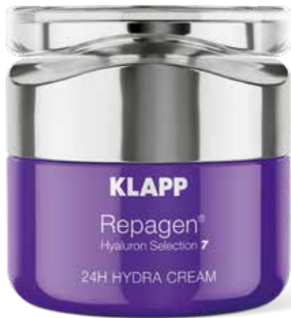
HYDRA CREAM // ГІДРОКРЕМ Код 7201. Об'єм: 50 мл

Інтенсивний крем для догляду за зрілою шкірою глибоко зволожує та підвищує природний рівень вмісту власної гіалуронової кислоти в шкірі, розгладжує зморшки, надає шкірі пружності, звужує пори, вирівнює мікротекстуру і загальний відтінок шкіри, справляє протизапальний і антикуперозний ефект. Легка текстура і приємний аромат забезпечують комфортне застосування. Відразу після нанесення, шкіра виглядає більш підтягнутою і сяючою.