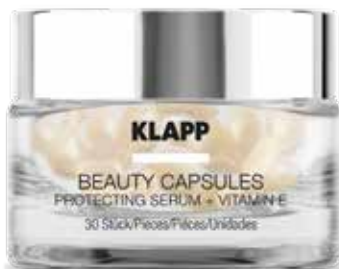
PROTECTING SERUM + VITAMIN E ЗАХИСТ + ВІТАМІН E Код 7208. Об'єм: 30 шт

Для сухої «втомленої» шкіри. Тонізує, нейтралізує вільні радикали, зв'язує і виводить шлаки і токсини. Підвищує влагуотримуючі властивості шкіри, звужує пори, вирівнює мікрорельєф, протидіє утворенню гіперпигментації, активізує колагеногенез, надає шкірі гладкості та пружності.