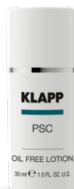
OIL FREE LOTION // ЕМУЛЬСІЯ «СЕБУМ ДОГЛЯД» Код 1115. Об'єм: 30 мл

Двофазний флюїд для швидкого усунення локальної запальної реакції шкіри, схильної до жирної себореї. Має протизапальну та бактеріостатичну дію, суттєво знижує виділення шкірного сала, має підсушувачий та протизапальний ефект.