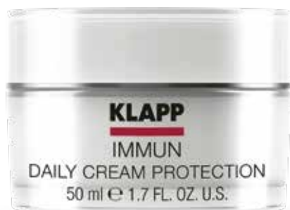
DAILY CREAM PROTECTION // КРЕМ «ДЕННИЙ ЗАХИСТ» Код 1706. Об'єм: 50 мл

Легкий крем зволожує та захищає шкіру від агресивного впливу зовнішнього середовища, є чудовою основою під макіяж. Ідеально підходить для сухої шкіри. Посилює систему самозахисту подразненої шкіри, запобігає процесу передчасного старіння.