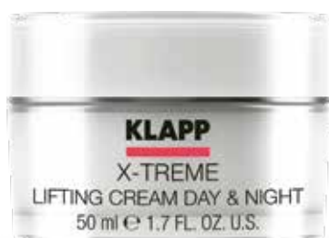
LIFTING CREAM DAY & NIGHT КРЕМ «ЛІФТИНГ ДЕНЬ-НІЧ» Код 1958. Об'єм: 50 мл

Фінішний крем з ефектом рідкої пудри нейтралізує вільні радикали, активізує клітинний обмін, підвищує пружність шкіри та зміцнює місцевий імунітет, матує та оптично вирівнює загальний тон шкіри.