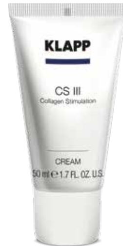
CREAM // КРЕМ Код 1542. Об'єм: 50 мл

Крем-флюїд, що містить наноконкомплекс ASCIII, активізує колагеногенез, зміцнює структуру шкіри навколо очей, підвищує її пружність і стійкість до впливу агресивних факторів зовнішнього середовища. Ефективно усуває почервоніння, сухість та набряк шкіри навколо очей.