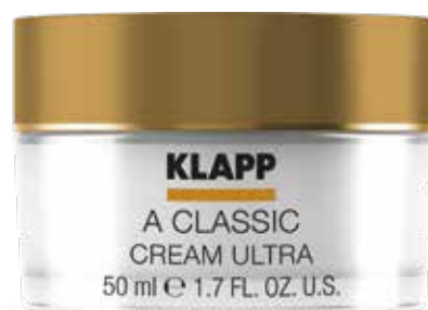
CREAM ULTRA // КРЕМ «УЛЬТРА» Код 1809. Об'єм: 50 мл

Комплексний крем багатієї насиченої текстури для догляду за зрілою шкірою. Захищає відновлювальні механізми шкіри та стимулює вироблення колагену. Врівноважує діяльність сальних залоз, освітлює та розгладжує шкіру, активізує процес регенерації. Ідеально підходить для вечірнього догляду за шкірою.