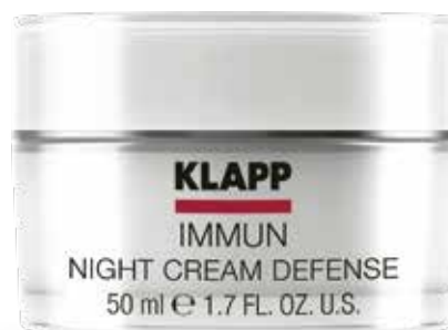
NIGHT CREAM DEFENCE // КРЕМ «НІЧНИЙ ЗАХИСТ» Код 1707. Об'єм: 50 мл

Легкий крем зволожує та захищає шкіру від агресивного впливу зовнішнього середовища, є чудовою основою під макіяж. Ідеально підходить для сухої шкіри. Посилює систему самозахисту подразненої шкіри, запобігає процесу передчасного старіння.