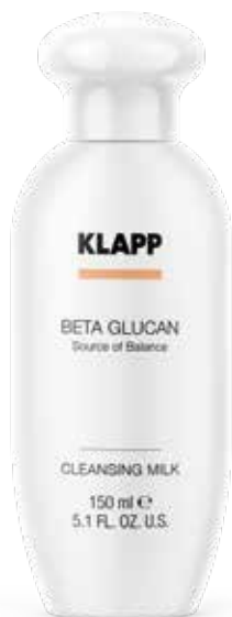
CLEANSING MILK // КРЕМ-ОЧИЩЕННЯ Код 1310. Об'єм: 150 мл

Основні діючі речовини: компонент \beta -glucan, фосфоліпіди рослинного походження, зволожуючий комплекс Hydrolite®, гель алое вера, алантоїн, пантенол.