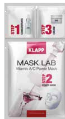
VITAMIN A/C POWER MASK ВІТАМІН А/С РЕВІТАЛІЗАЦІЯ Код 5107. Об'єм: 1 шт

Глибоко зволожує, розгладжує зморшки, формує овал обличчя, відновлюючи природний обсяг шкіри, висвітлює, зміцнює стінки кровоносних судин, усуває почервоніння й лущення. Надовго зберігає влагуотримуючі властивості шкіри.