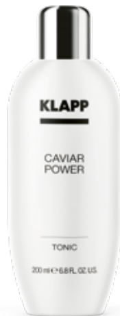
TONIC // ТОНІК Код 2516. Об'єм: 200 мл

Косметичне молочко використовується для демакіяжу та видалення найдрібніших часточок бруду, що закупорюють пори. Засіб не тільки очищує шкіру, але і зміцнює її захисні функції, зволожує, справляє протизапальний ефект.