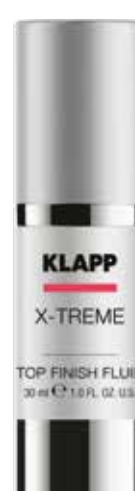
TOP FINISH FLUID КРЕМ «ТОП ФІНІШ» Код 1967. Об'єм: 30 мл

Спеціальний крем для денного догляду за шкірою, схильної до надмірної пігментації. Ефективно освітлює загальний тон шкіри, зволожує, нормалізує синтез та розподіл пігменту меланіну в шкірі, запобігає утворенню пігментних плям та забезпечує надійний захист від UV- випромінювання.