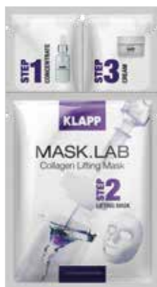
COLLAGEN LIFTING MASK КОЛАГЕН ЛІФТИНГ Код 5105. Об'єм: 1 шт

Основні діючі речовини: вишукані рослинні екстракти, життєво важливі амінокислоти та вітаміни, високотехнологічні інгредієнти.