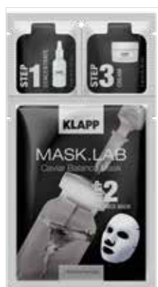
CAVIAR BALANCE MASK ІКРА-БАЛАНС Код 5109. Об'єм: 3 шт

Багатий склад маски забезпечує комплексний догляд за шкірою: зволожує, надає протизапальний і ранозагоювальний ефект, висвітлює пігментні плями і покращує клітинне дихання. Насичує шкіру фітоестрогенами, захищаючи її від стресу і забруднень навколишнього середовища, відновлює чутливу шкіру.