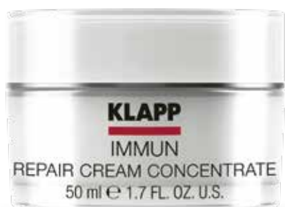
REPAIR CREAM CONCENTRATE КРЕМ-КОНЦЕНТРАТ «ВІДНОВЛЮЮЧИЙ» Код 1708. Об'єм: 50 мл

Концентрований засіб для курсового застосування, справляє значну антиерітемну та регенеруючу дію. Заспокоює та запобігає прояві ознак передчасного старіння. Підсилює систему самозахисту подразненої шкіри, швидко усуває почервоніння, нормалізує бар'єрні функції епідермісу, справляє живильну, відновлюючу та заспокійливу дію.