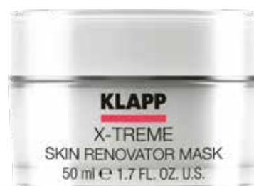
SKIN RENOVATOR MASK МАСКА КРЕМОВА «ВІДНОВЛЕННЯ» Код 1957. Об'єм: 50 мл

Високоактивний крем для швидкого відновлення пружності шкіри. Розгладжує зморшки, надає шкірі пружності та бархатистості, робить її гладенькою на дотик, захищає від агресивного впливу зовнішнього середовища. Містить цінні мікроелементи, вітаміни та життєво важливі амінокислоти.