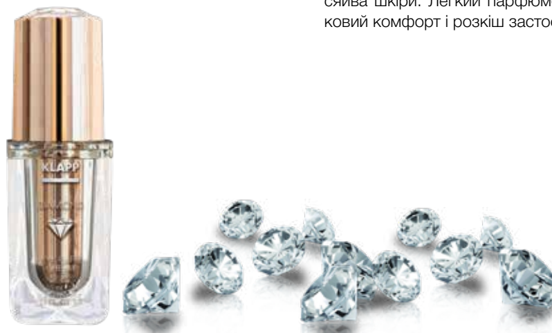
EYE CARE CREAM // КРЕМ ДЛЯ ПОВІК Код 4053. Об'єм: 15 мл

Висококонцентрована сироватка забезпечує рівномірне всмоктування препарату і робить можливим його самостійне застосування в якості вечірнього догляду за жирною і комбінованою шкірою. Надає ліфтинг і розгладження зморшок, глибоко зволожує, заповнюючи втрачений обсяг шкіри. Містить дрібнодисперсну алмазну пудру, яка м'яко полірує шкіру, чудово відображає світло і створює оптичний ефект сяйва шкіри. Легкий парфюмований аромат створює додатковий комфорт і розкіш застосування.