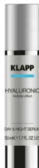
DAY & NIGHT SERUM // СИРОВАТКА «ДЕНЬ-НІЧ» Код 2531. Об'єм: 50 мл

Крем для комплексного догляду за шкірою має інноваційну крем-гелеву текстуру, відновлює гідроліпідний баланс епідермісу, легко всмоктується та справляє загальнооздоровчий вплив: глибоке зволоження, усунення почервоніння та відновлення цілісності епідермісу, антикуперозний ефект, розгладження зморшок, освітлення загального тону шкіри.