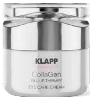
EYE CARE CREAM // КРЕМ ДЛЯ ПОВІК Код 2054. Об'єм: 20 мл

Живильний крем для сухої зрілої шкіри. Оксамитова текстура швидко поповнює ліпідний баланс епідермісу, вирівнює мікрорельєф, усуває стягнутість та подразнення, надає шкірі пружність та еластичність, сприяє розгладженню зморшок та формує овал обличчя. Справляє стимулюючу та тонізуючу дію, освітлює шкіру, надає їй бархатистості та природнього сяйва.