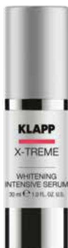
WHITENING INTENSIVE SERUM ВІДБІЛЮЮЧА СИРОВАТКА Код 1951. Об'єм: 30 мл

Інтенсивна сироватка для освітлення загального тону шкіри та запобігання появі пігментних плям. Нормалізує синтез та розподіл пігменту меланіну в шкірі. Ефективність препарату зумовлена накопиченням діючих компонентів в шкірі – в зв'язку з цим рекомендовано регулярне застосування.