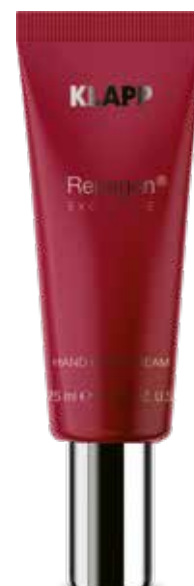
HAND CARE CREAM // КРЕМ ДЛЯ РУК Код 4310. Об'єм: 75 мл

Висококонцентрована сироватка відновлює епідермальний біоматрікс, розгладжує зморшки, надає шкірі пружності, глибоко зволожує, здійснює лімфодренаж. Мікрокапсульована пудра рубіну справляє загальнозміцнюючу дію, освіжає та створює особливе відчуття розкоші на шкірі обличчя.