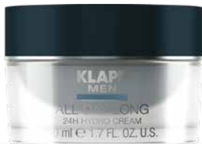
ALL DAY LONG 24H HYDRO CREAM ГІДРОКРЕМ 24 ГОДИНИ Код 4361. Об'єм: 50 мл

Усуває набряклість, відновлює пружність та свіжість шкіри, ефективно розгладжує зморшки, насичує шкіру необхідними вітамінами та мікроелементами, зволожує та підтягує шкіру, звужує пори та освіжає.