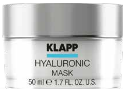
MASK // МАСКА КРЕМ-ГЕЛЕВА Код 1068. Об'єм: 15 мл

Інтенсивна ліфтингова сироватка ефективно підтягує, глибоко зволожує та освітлює шкіру. Запатентований пептидний комплекс Quicklift® забезпечує миттєвий ліфтинговий ефект, формує в шкірі підтримуючий каркас, а гіалуронова кислота заповнює «клітинки» цього каркасу, надаючи шкірі об'єм.