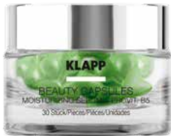
MOISTURIZING SERUM + PROVITAMIN B5 ЗВОЛОЖЕННЯ + ПРОВІТАМІН B5 Код 7206. Об'єм: 30 шт

Основні діючі речовини: цінні олігопептиди, рослинні біостимулятори клітинної активності, вітаміни та натуральні олії.