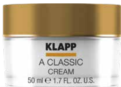
CREAM // КРЕМ Код 1802. Об'єм: 50 мл

Флюїд легкої консистенції з чистим ретинолом для антивікового догляду. Ефективно усуває прояви вікового старіння шкіри, відновлює клітинну активність та активізує колагеногенез. Олії ши, жожоба, шовкові протеїни та гіалуронова кислота живлять, пом'якшують і покращують регенерацію.