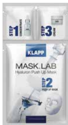
HYALURON PUSH UP MASK ГІАЛУРОН ПУШ АП Код 5106. Об'єм: 1 шт

Покращує пружність та еластичність зрілої шкіри, зміцнює структуру колагенових волокон, справляє ліфтинговий ефект, стимулює клітинну регенерацію, глибоко зволожує і розгладжує зморшки, надає шкірі свіжість і відчуття підтягнутості.