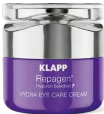
HYDRA EYE CARE CREAM // ГІДРОКРЕМ ДЛЯ ПОВІК Код 7203. Об'єм: 20 мл

Ексклюзивна сироватка для зволоження шкіри містить високоочищену 5-типну гіалуронову кислоту в концентрації, яка максимально допустима для поверхневого нанесення на шкіру. Ефективно відновлює гідробаланс на всіх рівнях шкіри, нейтралізує вільні радикали, стимулює вироблення власної гіалуронової кислоти, розгладжує зморшки та ущільнює шкіру, формуючи правильний овал обличчя.