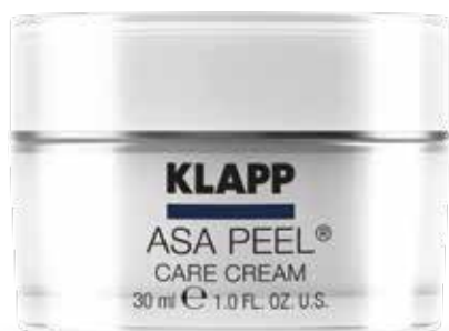
ASA PEEL® CREAM // КРЕМ-ПІЛІНГ Код 1840. Об'єм: 30 мл

Крем для підтримуючого домашнього догляду за обличчям після процедури салонного пілінгу. Основна дія – полегшення відлущування ороговілих часточок та відновлення гідроліпідного балансу епідермісу, згладжування нерівностей мікрорельєфу шкіри, освітлення пігментних плям.