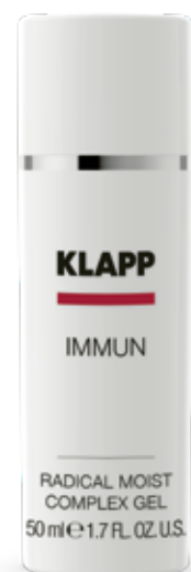
RADICAL MOIST COMPLEX ФЛЮЇД «РАДИКАЛЬНЕ ЗВОЛОЖЕННЯ» Код 1713. Об'єм: 50 м

Концентрований засіб для курсового застосування, справляє значну антиерітемну та регенеруючу дію. Заспокоює та запобігає прояві ознак передчасного старіння. Підсилює систему самозахисту подразненої шкіри, швидко усуває почервоніння, нормалізує бар'єрні функції епідермісу, справляє живильну, відновлюючу та заспокійливу дію.