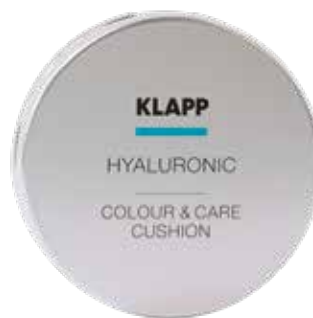
COLOUR & CARE CUSHION 02 КРЕМ-КУШОН 02 СЕРЕДНІЙ Код 2561. Об'єм: 15 г