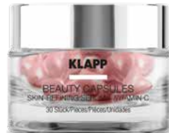
SKIN-REFINING SERUM + VITAMIN C ОЧИЩЕННЯ + ВІТАМІН C Код 7207. Об'єм: 30 шт

Для зрілої зневодненої шкіри, схильної до подразнення. Зволожує, нормалізує захисні функції шкіри, має протизапальну дію, сприяє оновленню клітин, активізує синтез колагену, покращує еластичність і пружність шкіри.