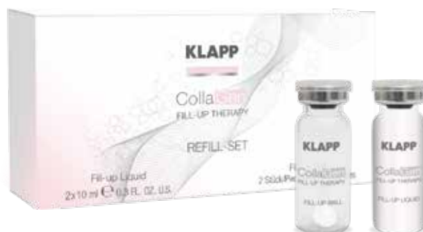
CONCENTRATE // КОНЦЕНТРАТ КОД 2052. ОБ'ЄМ: КОЛАГЕНОВА КУЛЬКА – 2 ШТ, АКТИВАТОР – 2X10 МЛ

До складу набору входить концентрат та вібромасажер. Вібраційний мікромасаж прискорює клітинний енергообмін, звільняє шкіру від ороговілих часток, усуває набрякність, чинить тонізуючу дію. Завдяки вібрації відбувається розширення міжклітинного простору та здійснюється глибоке проникнення косметичних засобів в шкіру. Масажер використовується безпосередньо після нанесення сироватки шляхом обробки поверхні шкіри по масажних лініях впродовж 3-5 хвилин.