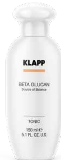
TONIC // ТОНІК Код 1311. Об'єм: 150 мл

Легко видаляє забруднення та залишки макіяжу з обличчя та очей, не порушуючи гідроліпідного балансу шкіри, має проти-запальну та ранозагоювальну дію.