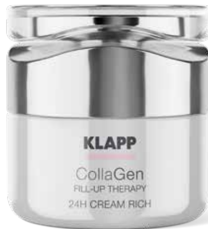
24H CREAM RICH // ЖИВИЛЬНИЙ КРЕМ Код 2056 Об'єм: 50 мл

Крем ніжної текстури з витонченим трав'яним ароматом ефективно поповнює нестачу і підсилює синтез власного колагену, відновлює тонус і пружність шкіри, розгладжує зморшки, глибоко зволожує.