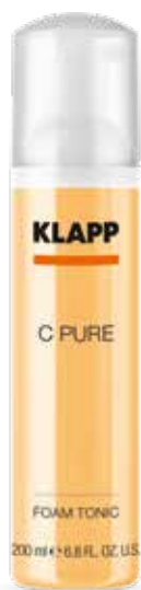
FOAM TONIC // ПІНА-ТОНІК Код 1507. Об'єм: 200 мл

Пінка для вмивання із свіжим цитрусовим ароматом ніжно очищує шкіру обличчя, шиї та декольте. Завдяки кремopodobній структурі діє м'яко, але ґрунтовно, не порушуючи гідроліпідний баланс шкіри.