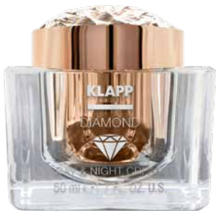
DAY & NIGHT CREAM // КРЕМ Код 4054. Об'єм: 50 мл

Вишуканий крем м'якої текстури пом'якшує шкіру, прискорює внутрішньоклітинні обмінні процеси, розгладжує зморшки, надає ефект ліфтингу. Містить дрібнодисперсну алмазну пудру, яка м'яко полірує шкіру, чудово відображає світло і створює оптичний ефект гладкості та сяйва.