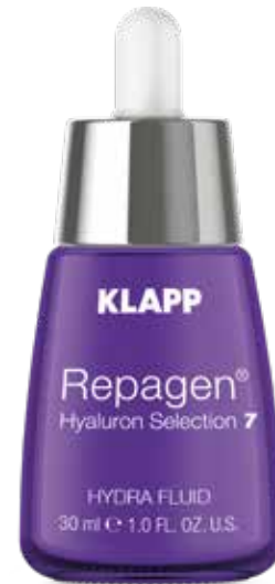
HYDRA FLUID // ГІДРОФЛЮІД Код 7202. Об'єм: 30 мл

Інтенсивний крем для догляду за зрілою шкірою глибоко зволожує та підвищує природний рівень вмісту власної гіалуронової кислоти в шкірі, розгладжує зморшки, надає шкірі пружності, звужує пори, вирівнює мікротекстуру і загальний відтінок шкіри, справляє протизапальний і антикуперозний ефект. Легка текстура і приємний аромат забезпечують комфортне застосування. Відразу після нанесення, шкіра виглядає більш підтягнутою і сяючою.