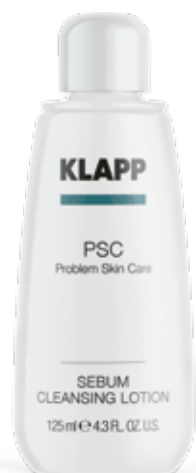
SEBUM CLEANSER LOTION ТОНІК «СЕБУМ ОЧИЩЕННЯ» Код 1113. Об'єм: 125 мл

Основні діючі речовини: себорегулюючий комплекс ASEBIOL® BT2, молочна та саліцилова кислоти, алантоїн, сечовина, біотин, вітаміни та рослинні екстракти.