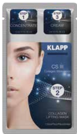
HOME TREATMENT // ДОМАШНЯ ПРОЦЕДУРА Код 1546. Об'єм: 1 уп

Живильний крем легкої консистенції надає комплексну омолоджуючу дію, підвищує пружність шкіри, зволожує, пом'якшує та відновлює бар'єрні функції епідермісу, нейтралізує вільні радикали, активізує клітинну регенерацію.