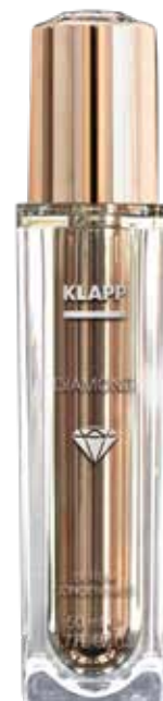
SERUM CONCENTRATE // СИРОВАТКА Код 4050. Об'єм: 50 мл

Вишуканий крем м'якої текстури пом'якшує шкіру, прискорює внутрішньоклітинні обмінні процеси, розгладжує зморшки, надає ефект ліфтингу. Містить дрібнодисперсну алмазну пудру, яка м'яко полірує шкіру, чудово відображає світло і створює оптичний ефект гладкості та сяйва.