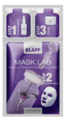
HYALURON 7 INTENSIVE MOISTURIZING MASK // ГІАЛУРОН 7 Код 5110. Об'єм: 3 шт

Глибоко зволожує, формує підтягнутий овал обличчя, розгладжує зморшки, освітлює пігментні плями, вирівнює мікротекстуру та загальний відтінок шкіри, надає протизапальний ефект, усуває почервоніння і лущення, відновлює гідроліпідний баланс епідермісу і нормалізує захисні функції чутливої шкіри.