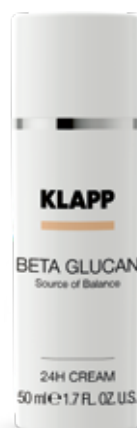
24H CREAM // КРЕМ Код 1312. Об'єм: 50 мл

Дарує відчуття свіжості, видаляє залишки засобів для вмивання та води. Нормалізує рН шкіри та завершує етап очищення.