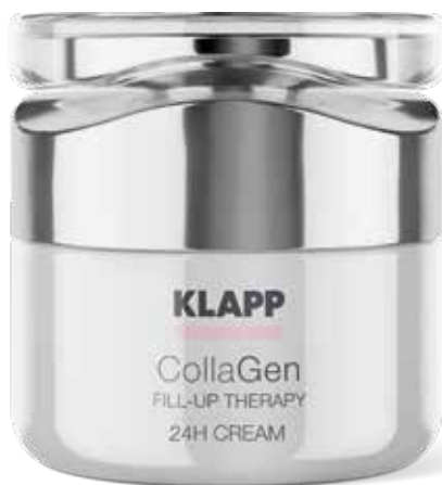
24H CREAM // КРЕМ Код 2050 Об'єм: 50 мл

Крем ніжної текстури з витонченим трав'яним ароматом ефективно поповнює нестачу і підсилює синтез власного колагену, відновлює тонус і пружність шкіри, розгладжує зморшки, глибоко зволожує.