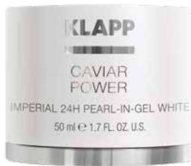
CAVIAR POWER IMPERIAL 24H PEARL-IN-GEL WHITE КРЕМ ДЛЯ ОБЛИЧЧЯ «БІЛА ІКРА 24Г» Код 2564. Об'єм: 50 мл

Збагачує шкіру цінними рослинними компонентами, які звожують, відновлюють та активізують вироблення колагену, необхідного для еластичності і пружності шкіри. Протидіє природним процесам старіння шкіри, дарує відчуття комфорту вдень і вночі, надає шкірі благородної бархатистості та матового відтінку.