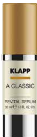
REVITAL SERUM // СИРОВАТКА «РЕВІТАЛ» Код 1806. Об'єм: 30 мл

Висококонцентрована сироватка для інтенсивного догляду насичує шкіру повним комплексом вітамінів, має виражену зволожуючу та ліфтингову дію. Надзвичайно легка текстура забезпечує швидке проникнення в шкіру та миттєвий результат.