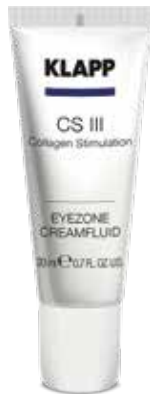
EYE ZONE CREAM FLUID // КРЕМ-ФЛЮІД ДЛЯ ПОВІК Код 1540. Об'єм: 20 мл

Крем-флюїд, що містить наноконкомплекс ASCIII, активізує колагеногенез, зміцнює структуру шкіри навколо очей, підвищує її пружність і стійкість до впливу агресивних факторів зовнішнього середовища. Ефективно усуває почервоніння, сухість та набряк шкіри навколо очей.