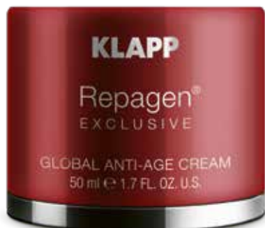
GLOBAL ANTI-AGE CREAM // КОМПЛЕКСНИЙ КРЕМ Код 4306. Об'єм: 50 мл

Комплексний крем протидіє старінню шкіри та відновлює епідерміс на всіх трьох рівнях. Покращує еластичність та глибоко зволожує шкіру з ефектом заповнення зморшок, відновлює водно-сольовий баланс, усуває набряклість та гіперкератоз, розгладжує зморшки, надає ефект ліфтингу, насичує шкіру дорогішими вітамінами, мікроелементами та амінокислотами. Шкіра стає пружною та гладенькою, виглядає значно молодшою, набуває рівномірного відтінку.