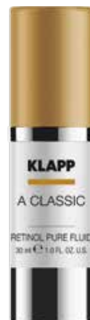
RETINOL PURE FLUID // ЕМУЛЬСІЯ «РЕТИНОЛ» Код 1814. Об'єм: 30 мл

Висококонцентрована сироватка для інтенсивного догляду насичує шкіру повним комплексом вітамінів, має виражену зволожуючу та ліфтингову дію. Надзвичайно легка текстура забезпечує швидке проникнення в шкіру та миттєвий результат.