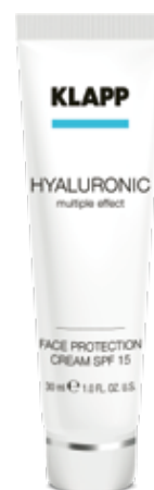
FACE PROTECTION CREAM SPF 15 // КРЕМ «SPF 15» Код 2557. Об'єм: 30 мл

Інтенсивно зволожує, розгладжує зморшки, прискорює клітинну регенерацію, зміцнює стінки судин, вирівнює мікрорельєф. Шкіра виглядає сяючою, набуває здорового відтінку та природнього сяйва.