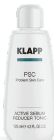
ACTIVE SEBUM REDUCER TONIC ТОНІК «СЕБУМ РЕГУЛЯТОР» Код 1114. Об'єм: 125 мл

Антисептичний тонік для інтенсивного очищення проблемної шкіри, дезінфекції проблемних ділянок та вогнищ запалення. Здійснює протизапальну та бактеріостатичну дію, нормалізує діяльність сальних залоз.