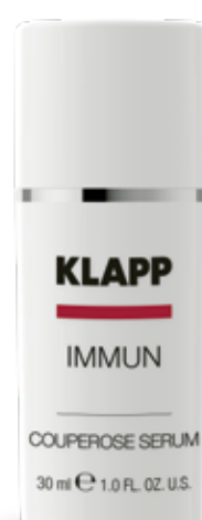
COUPEROSE SERUM // ПРОТИКУПЕРОЗНА СИРОВАТКА Код 1715. Об'єм: 30 мл

Гель для ефективного догляду за чутливою шкірою навколо очей. Швидко усуває подразнення та почервоніння, зволожує, підвищує захисні функції шкіри. Ідеально підходить для людей, які носять окуляри та контактні лінзи.