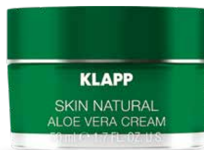
ALOE VERA CREAM // КРЕМ Код 1191. Об'єм: 50 мл

Висококонцентрований натуральний сік листа алое ефективно поєднує в собі властивості косметичної сироватки і самостійного засобу для догляду за шкірою. Має протизапальну та антибактеріальну дію, сприяє відновленню захисних функцій шкіри, запобігає передчасному старінню, надає шкірі гладкості. Призначений для глибокого зволоження шкіри, відновлення пошкоджених клітин та загоєння мікроушкоджень шкіри.