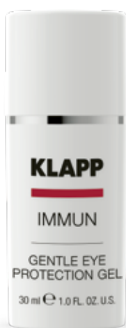
GENTLE EYE // ГЕЛЬ ДЛЯ ПОВІК Код 1711. Об'єм: 30 мл

Ультралегка емульсія з миттєвим зволожуючим ефектом. Ідеально підходить для чутливої та проблемної шкіри. Підсилює систему самозахисту подразненої шкіри, запобігаючи процесу передчасного старіння, усуває подразнення та нормалізує бар'єрні функції епідермісу.